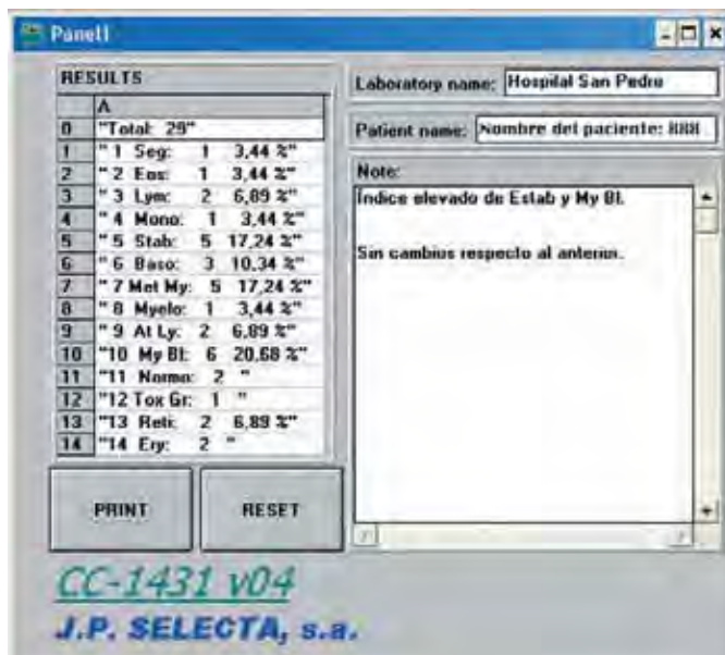
Software de descarga y confección del informe.